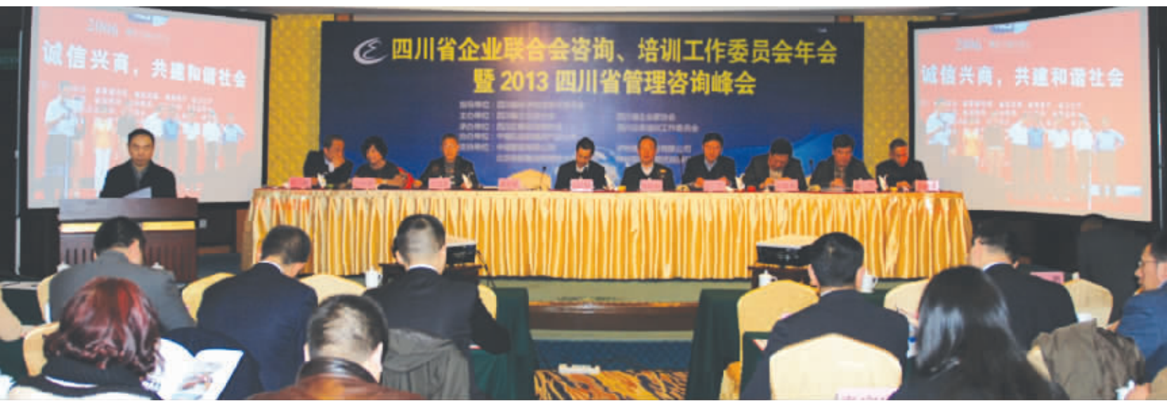
四川省企业联合会咨询、培训工作委员会年会暨2013四川省管理咨询峰会