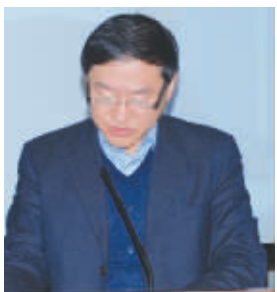
四川省国资委主任丁副主任宣读2013四川省十佳企业管理咨询机构表彰决定。