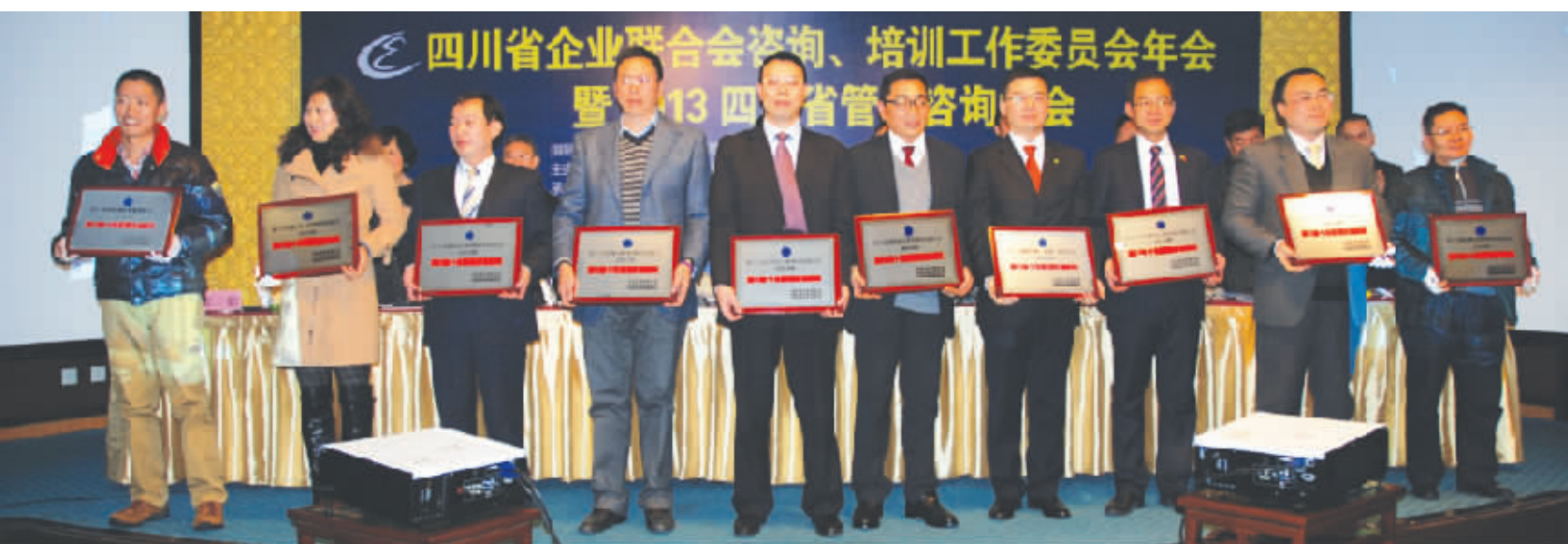
受表彰的四川省十佳企业管理咨询机构