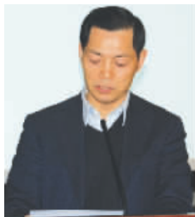
四川省经济和信息化委员会副主任张国斌在会上致辞。