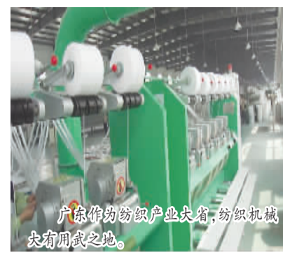
广东作为纺织产业大省,纺织机械大有用武之地。