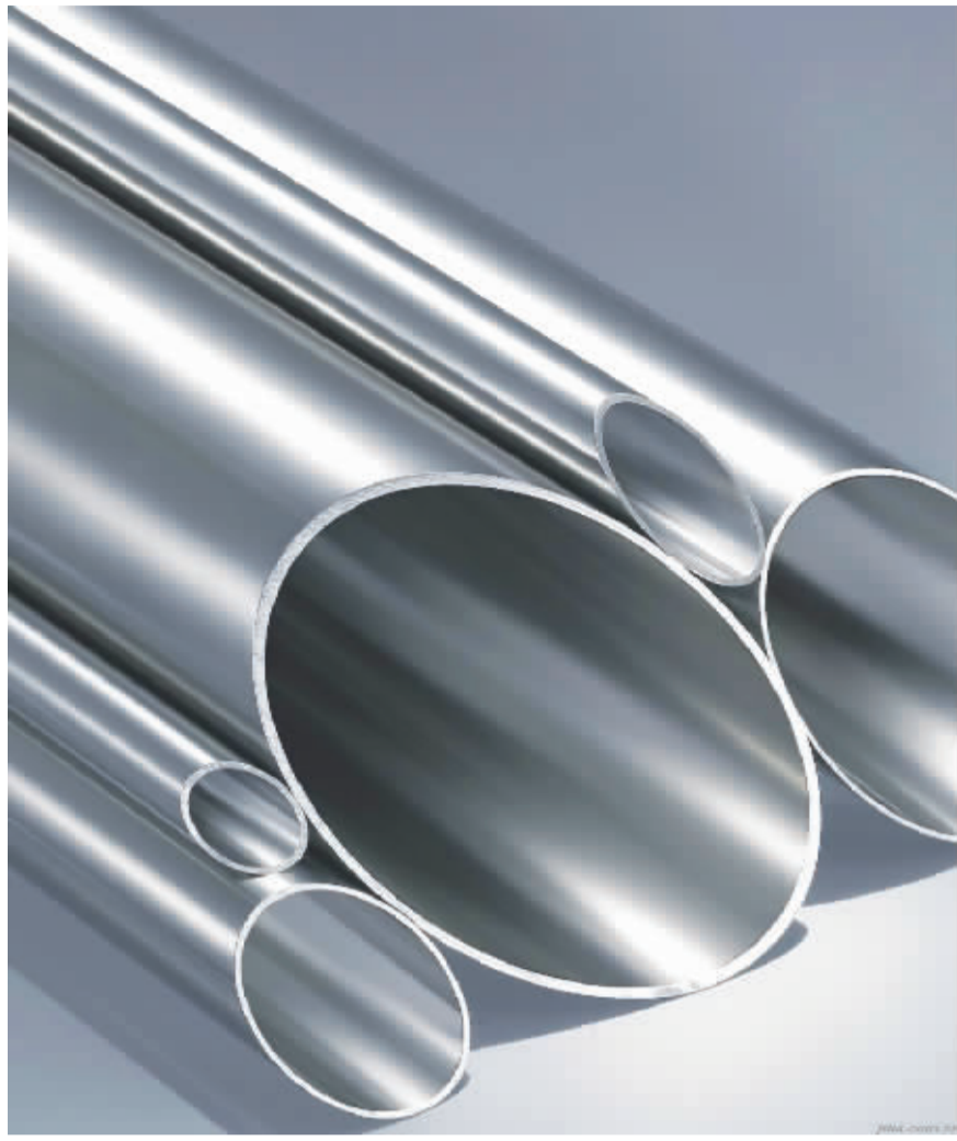
五金、锁具与家居相关的五金产品在2012年年末需求减小,销量保持稳定,目前家居五金产品主流消费人群为80、90后这些年轻群体,对于产品定位趋势也转变较快,环保、时尚、品质、个性的产品符合在年轻消费群体的价值观,市场不少商户也对此做出产品结构的调整。另外,管材和各种五金原材料,价格波动较大。春节长假前期,随着下游厂家和商户的陆续休市,五金原材料市场基本处于有价无市的状态,市场需求出现缺口,对来年的原材料市场有促进作用,但是依然存在一定的风险因素,到时重点需要关注的因素包括:需求释放是否顺畅、宏观层面的各种要素有什么新的调整,这些都还需要走一步看一步。

焊机、焊具和焊材类、电工电气类、电线电缆类产品,大多以走量为主,相对于电工电气和电线电缆类产品来说,焊材类产品消耗量显得更大些。从2012年年底的规模指数也可以看出,焊机、焊具和焊材类产品销量明显多于电工电气和电线电缆类产品,预计2013年此类产品销量会保持稳定。另外,电工电气类、电线电缆类产品与市政建设、房地产市场的景气程度也息息相关,在2013年也需关注相关市场的动向和趋势,