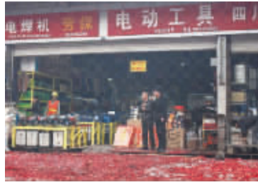
万贯五金机电城各商家店铺门前鞭炮声声声彩头

祥龙腾岁辞旧岁,金蛇吐瑞新春来。大年初九,浓浓的年味儿仍然浸透着中华大地。在这欢乐祥和、充满希望的美好时刻,成都市万贯五金机电城在喜庆的气氛中开门营业了!“噼里啪啦”、“轰”、“轰”、“轰”……鞭炮声声响云霄,喜气洋洋开业忙。每年春节,机电城内各商家都会在返市营业的当天燃放鞭炮庆祝开门,以讨个好彩头,希望取得开门红、开门红。喜庆之余,让我们一起来听听商家朋友们都有哪些新年愿景和规划,新的一年对万贯又有什么寄语。