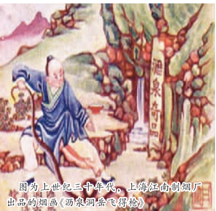
图为上世纪三十年代,上海江南制烟厂出品的烟画《汤泉洞岳飞得胜》

上世纪三十年代,以蛇为题材的烟画渐渐多了起来,尤以《白蛇传》烟画热闹一时。彼时,上海流行机关布景的“彩头戏”,有一个剧团在《白蛇传》剧中,加上不少恐怖的表演手法。《申报》上的戏剧广告不仅大登“真蛇上台”,还登出“台下孩童大受惊魂”等新闻,一时将《白蛇传》炒得火热。上海诸烟厂便以此为由推出了数套《白蛇传》和《白蛇传人物》等烟画,为他们的产品助阵促销。