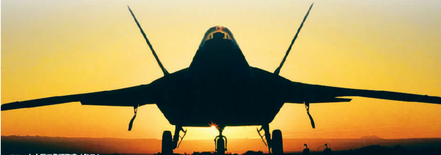
2011 九大军工集团资产 (亿元)