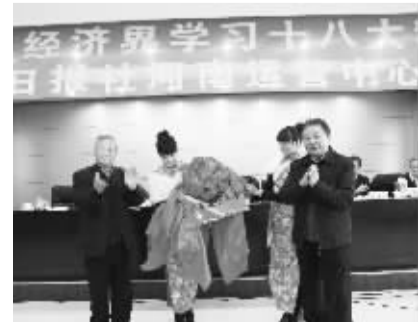
●河南运营中心揭牌仪式。

企业家日报社首家运营中心的成立，标志着企业家日报社走上了做大做强传媒业的新征程，也开辟了企业家日报服务企业和企业家的新途径。