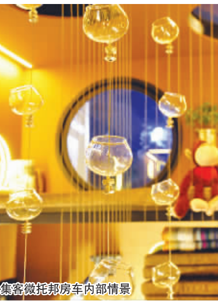
集客微托邦房车内部情景

据悉,来自全国的自驾志愿者、媒体代表等将随行前往洛阳、西安、兰州、西宁、青海湖、甘南、九寨沟等旅游胜地,宣传青年创意并提倡更具责任感的旅游,使创意与旅游、环保与梦想有机契合。(周莉)