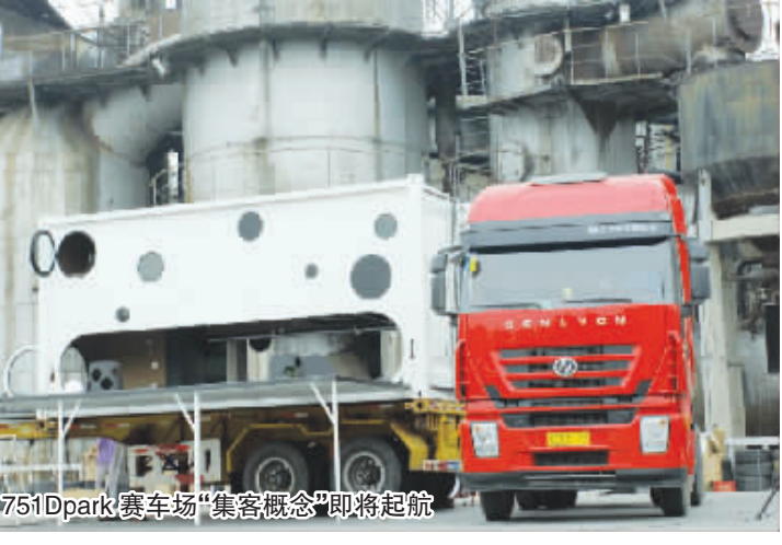
751Dpark 赛车场“集客概念”即将起航

将废弃的二手集装箱改制成国内首款时尚房车。参与集装箱设计改造的年轻设计师、通过去哪儿网征集的旅途集客和自驾体验者,在上汽依维柯红岩的全程赞助下,将时尚房车用同步欧洲科技的重卡产品——红岩杰狮牵引,于8月18日开启了全程自驾“集客·微托邦梦想之旅”。