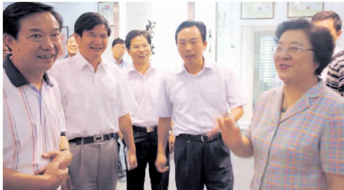
2009年9月15日相关领导参观中国陶都陶瓷艺术国际博览中心(右一:全国政协副主席林文漪,右二:时任无锡市委常委、宜兴市委书记蒋洪亮,左二;无锡市政协副主席主席左祖能,右三:宜兴市委常委、丁蜀镇党委书记蒋洪亮)。