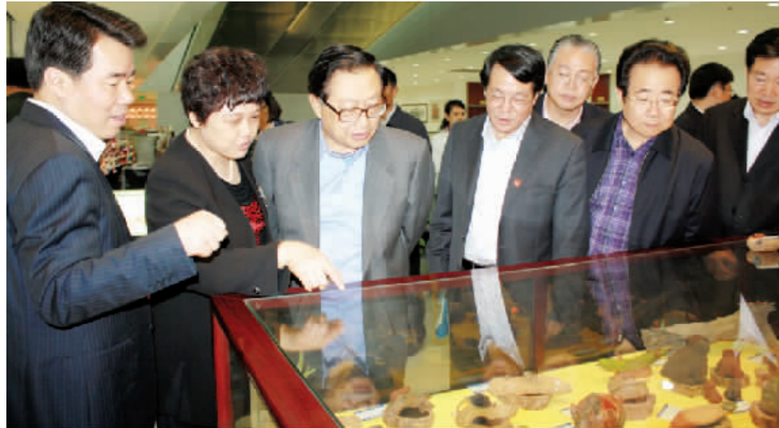
2012年4月20日宜兴市委副书记董平陪同全国人大常委会副委员长李建国等省领导视察指导中国陶都陶瓷城。