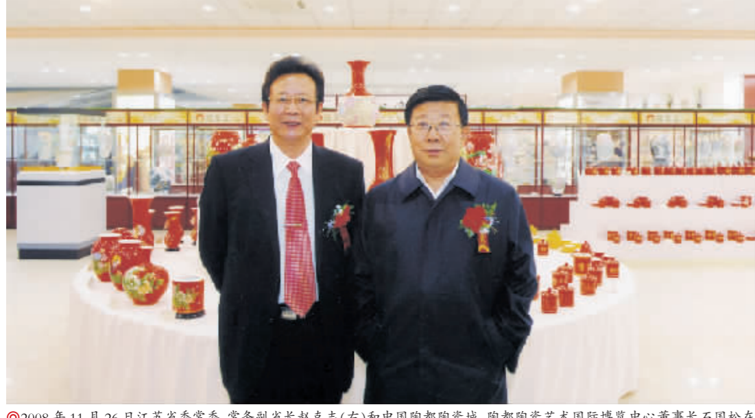
2008年11月26日江苏省委常委、常务副省长赵克志(右)和中国陶都陶瓷城、陶都陶瓷艺术国际博览中心董事长石国松在陶瓷城合影。