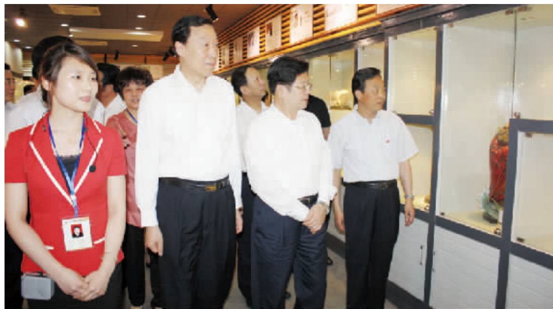
2011年5月8日中共中央政治局委员、全国人大常委会副委员长、中华全国总工会主席王兆国，江苏省委副书记罗志军等在时任无锡市委常委、宜兴市委书记蒋洪亮的陪同下视察指导中国陶都陶瓷城。