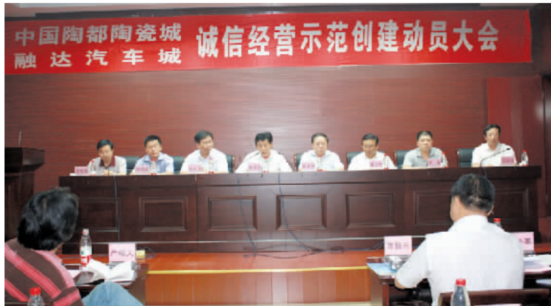
中国陶都陶瓷城诚信经营示范创建动员大会