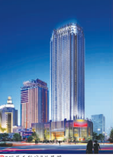
◎“丽原天际城”效果图

据了解,二老一年要审查200多个项目,他们的审图质量在广西已做立群首,一些主要理论和理念也是超前的。他们的目标,把图正公司打造成广西第一,全国一流的审图公司。