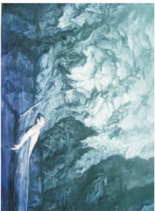
floating no. 10, 300cmX200cm, 2007, oil on canvas