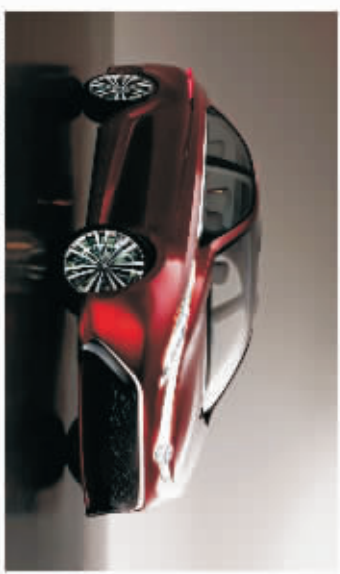
TOYOTA DEAR~亲~ (三阳)