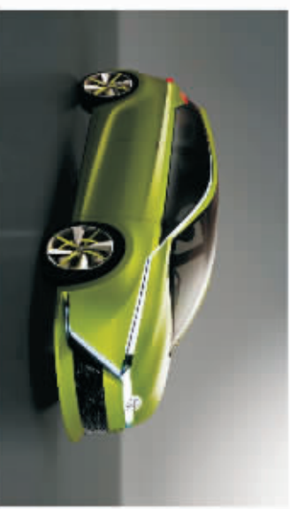
TOYOTA DEAR~亲~ (阿那)

在本次车展上丰田推出的ALPHARD埃及去福利车，配有自动进出座舱设备，关爱乘客每一位驾乘者，并减轻照顾这些行动不便人士的负担。