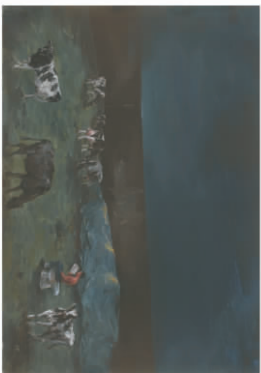
迷墙 Lost Wall, 布面油画 Oil on canvas, 180X250cm, 2012