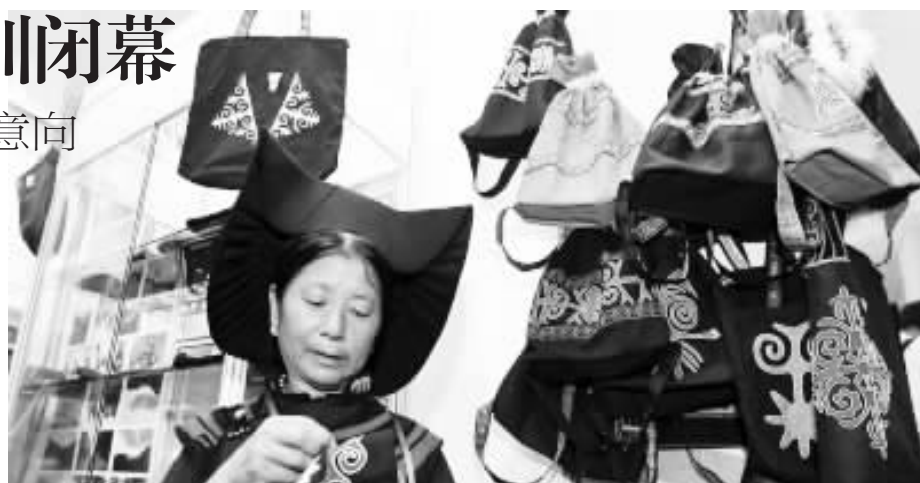
公益市集上,凉山州麻风病综合防治项目办公室带来的麻风病人的手工绣品。

环境文化促进会并带领一大批环保 NGO,携 40 多个环保公益创意计划和项目参与合作,这是国家环保部首次派出专业机构参与公益慈善展。