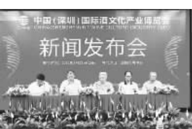
深圳酒博会将每年举办一届。图为 2012 中国(深圳)国际酒文化产业博览会新闻发布会现场。

所属行业: 糖酒会 - 食品 饮料 展会时间: 2012年8月23日 - 2012年8月26日 展场展馆: 深圳会展中心 展会地区: 广东 深圳市 展览范围: 名酒品牌特装展区; 国际酒综合展区; 中国酒综合展区; 酒类上下游产业综合展区; 主题文化展区。 联系方式—— 固定电话: 0755-82222201 转酒博会组委会 传真: 0755-82361717 电子邮箱: 联系地址: 深圳市宝安区宝安体育中心游泳馆二楼 展会网址: http://www.goodwine.cc