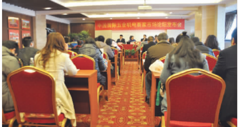
2011年12月15日中国国际五金机电市场百家论坛新闻发布会现场。

各自为战,处于严重的无序竞争状态。各自为政或者偏隅一方,已经不能适应行业发展的需要。每一个市场都应探索如何做活经济,繁荣市场,不断尝试新的模式,为商家、厂家提