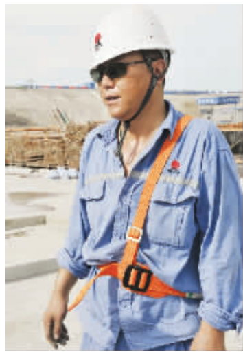
□ 申建生 崔影 文/图

每天早上6点20分，电工们又在孙班长的带领下，把昨天晚上安装的照明灯逐一拆除，整齐地放到一个大照明箱里。