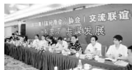
由四川省闽南商会发起的四川友好商会联谊会成功举办。

商会地址:成都市青龙街18号罗马国际1号楼19楼 11911-11912 邮编:610017 联系电话:028-86283206 传真:028-86283206 网址:http://www.scshsh.com