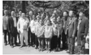
2011年3月31日,商会组织“晋商凉山行”投资考察团一行与接受帮扶的美姑孩子们合影。

四川省山西商会经四川省民政厅登记注册,并在四川省招商局指导下于2006年12月29日在四川成都正式成立。