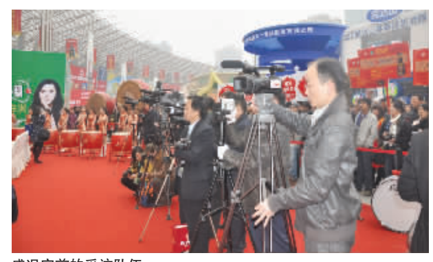
盛况空前的采访队伍