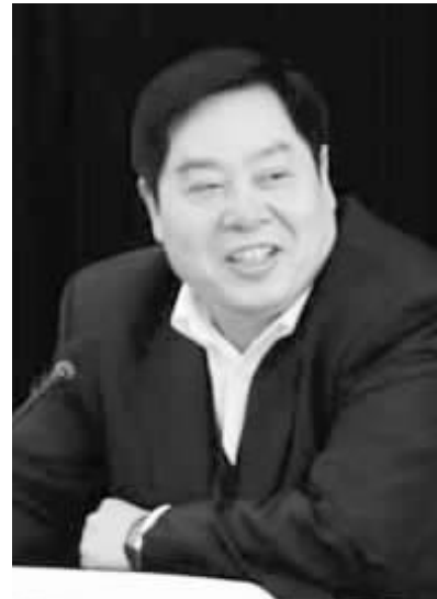
座谈会上河南省商务厅厅长李清树讲话

为了充分发挥已在豫投资韩国企业以商邀商重要作用,经过精心准备,近日,韩国在豫投资企业代表座谈会召开。河南省公安厅、省工商局、省出入境检验检疫局、郑州海关、中国银行河南省分行和省商务厅相关处室的有关负责同志参加了座谈会。