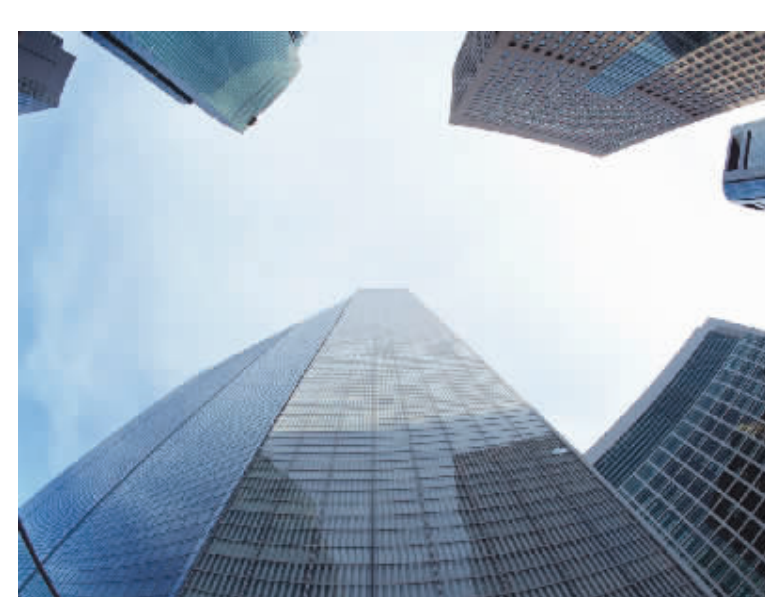
楼盘，在当下这一时间段仿佛是“潮”自从市区出台限购政策后，从售楼

正是这一考虑让很大一部分购房者开始将慎重的目光投向了市区高端电梯公寓。“当然，那种浮于表面的，华而不实的高端楼盘无疑对他们来说就是‘伪高端’。”他认为，很多标榜每平方米精装花了多少钱，价格因此飙升到近两万的高档