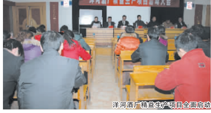
洋河酒厂精益生产项目全面启动

新年伊始，江苏洋河酒厂股份有限公司全面启动精益生产管理项目，召开了项目启动会，拉开了企业2011年管理年活动的序幕。