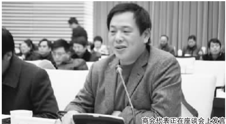
商会代表正在座谈会上发言

听取了与会商会代表的发言后,吴存荣表示,外来投资对合肥的经济发展作出了很大贡献,而合肥正是营造了一个尊重外来企业的投资环境,才得以吸引广大商家前来合肥落户。在市场经济中主体是企业,政府部门应该在幕后为企业的快速健康发展提