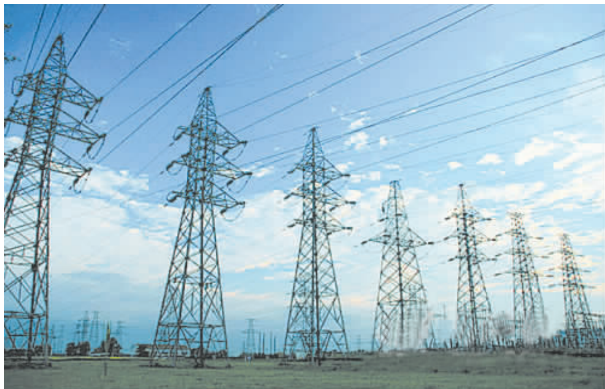
国有经济应对关系国家安全和国民经济命脉的重要行业和关键领域保持绝对控制力，这包括军工、电网电力、石油石化、电信、煤炭、民航、航运等七大行业。

大的华孚集团公司的资产总额也仅为17亿元，与相关产业集团动辄上百亿的资产规模相去甚远。上述两家贸易类央企涉及的控股上市公司分别为华联股份和酒鬼酒。目前有迹象表明，中商集团有可能被纳入“中投二号”，而华孚正在中储粮与中粮集团之间选择“婆家”。