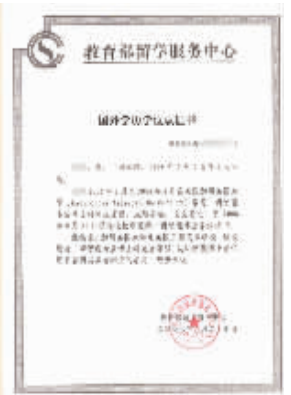
硕博学位在全球国际认证与注册协会的认证