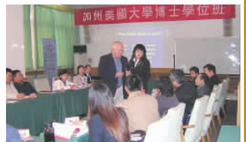
联合国教科文组织和北大清华等专家为学员授课

California American University(也称“加州美国大学或加利福尼亚美洲大学”)是美国教育文化基金会(U.S. Education & Culture Foundation)直属正规大学(美国加州州政府教育部 www.bppve.ca.gov. 美国联邦政府移民局 www.ice.gov. 大学 www.calamuniv.edu),总校位于美国加州洛杉矶阿南布拉市,校园环境舒适优美,现有二千多名在校生及数百名毕业于全球名校的博士级教授。学员以美籍为主且大都是工商界的高级主管与精英,还有中国大陆及港澳台和全球数十个国家的国际学员,其中不少学员已在本国政府身居要职或担任工商及金融高级主管。