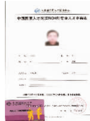
硕博学位在中国国家高级管理人才的认证