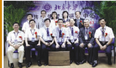
优秀学员被评为北京大学或中国教育研究会研究员