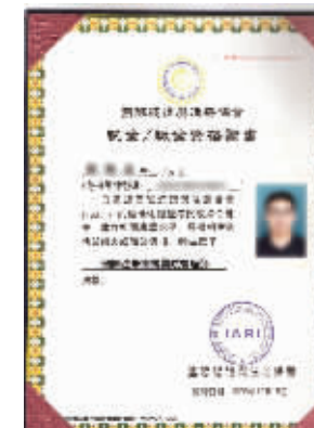
硕博学位在全球国际认证与注册协会的认证