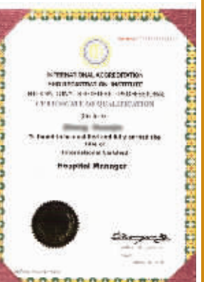
硕博学位在全球国际认证与注册协会的认证