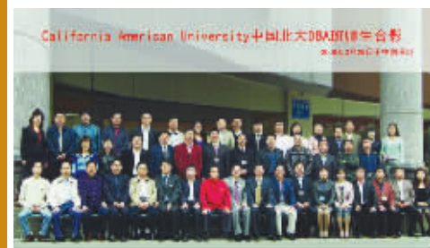
国务院学位评委会和国家人保部等专家出席 CAU 开学典礼