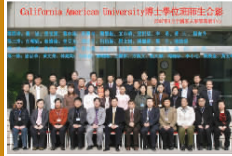
CAU 毕业学员与中国有关部委领导和专家合影