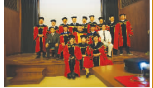
学员与 CAU 总校校长和教育长在总校合影