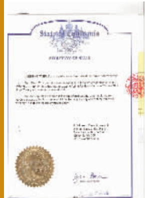
硕博学位在美国相关政府的认证