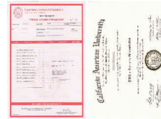
学位证书和成绩单