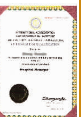
硕博学位在全球国际认证与注册协会的认证