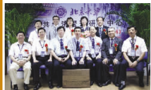
优秀学员被评为北京大学或中国教育研究会研究员