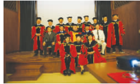
学员与 CAU 总校校长和教育长在总校合影