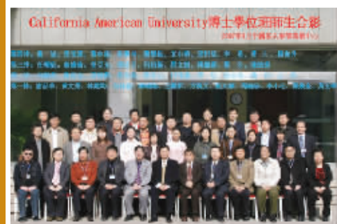
CAU 毕业学员与中国有关部委领导和专家合影