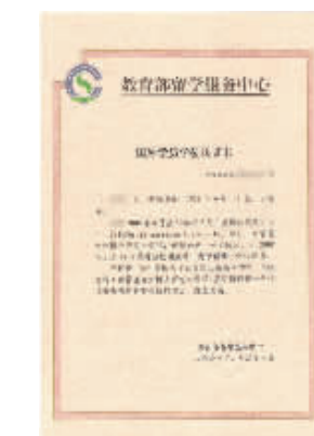
留学硕博学位在中国教育部相关机构的认证