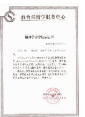
留学硕博学位在中国教育部相关机构的认证