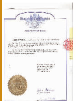
硕博学位在美国相关政府的认证