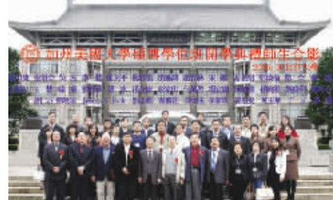
CAU 总校教育长与学员在中国合影