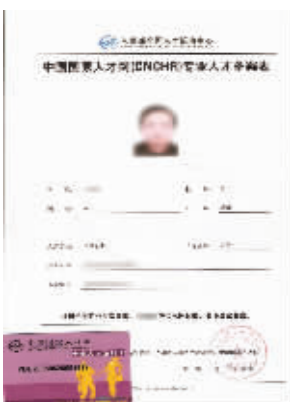
硕博学位在中国国家高级管理人才的认证