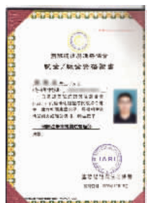
硕博学位在全球国际认证与注册协会的认证