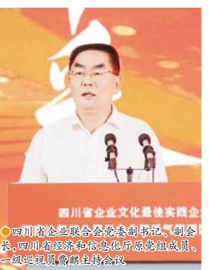
四川省企业联合会党委副书记、副会长、四川省经济和信息化厅原党组成员、一级巡视员费麒主持