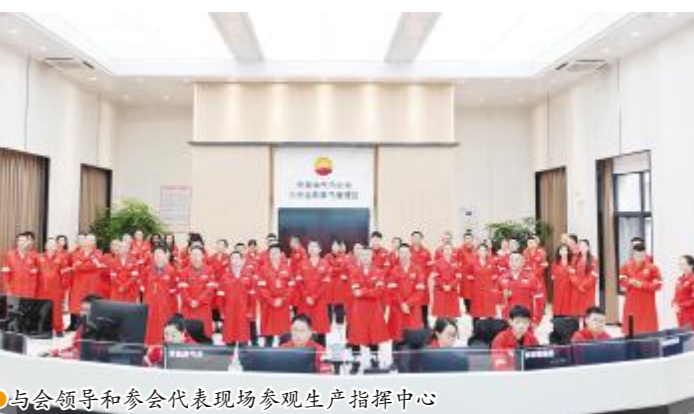
与会领导和参会代表现场参观生产指挥中心

国家文化强国战略为根本遵循，自觉将企业发展融入国家能源安全新战略大局，把“为国争气、为民供能”作为文化建设的初心使命，将国家战略要求转化为企业上下的思想共识与行动自觉。始终坚持传承不守旧、创新不离宗，深度挖掘四川油气田创业历程中的文化精髓，将“石油师”红色基因、川中石油会战精神、“川油精神”等行业优良传统，与新时代国企改革要求、企业发展实际有机融合，赋予传统精神新的时代内涵。“聚力向新、气蕴华采”的“聚气”文化内涵，既传承了石油战线“艰苦创业、无私奉献”的精神底色，又融入了新时代“改革创新、团结奋进”的时代特质；既彰显了川中油气开发“扎根巴蜀、深耕气田”的地域特色，又体现了“开放协同、共赢发展”的现代企业理念。这种立足传统、面向未来的文化传承创新，让行业精神在新时代焕发源新的生机与活力，为企业发展注入了源源不断的动力。“聚气”文化紧扣改革痛点、聚焦发展难点，以文化理念的更新引领思想观念的转变，以文化共识的形成推动改革合力的凝聚，让文化成为改革攻坚的“精神引擎”，确保了“油公司”模式改革试点工作高效推进、取得实效。精准契合全省“十五五”坚持思想引领、强化政治铸魂的文化建设总要求，为全省基层企业文化建设树立了政治引领样板。