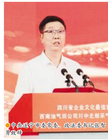
中共遂宁市委常委、政法委书记张智勇致辞