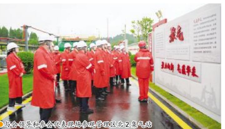
与会领导和参会代表现场参观管理区北2集气站