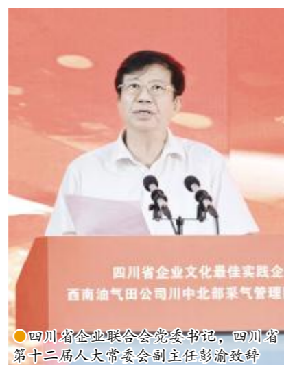
四川省企业联合会党委书记、四川省第十二届人大常委会副主任彭渝致辞