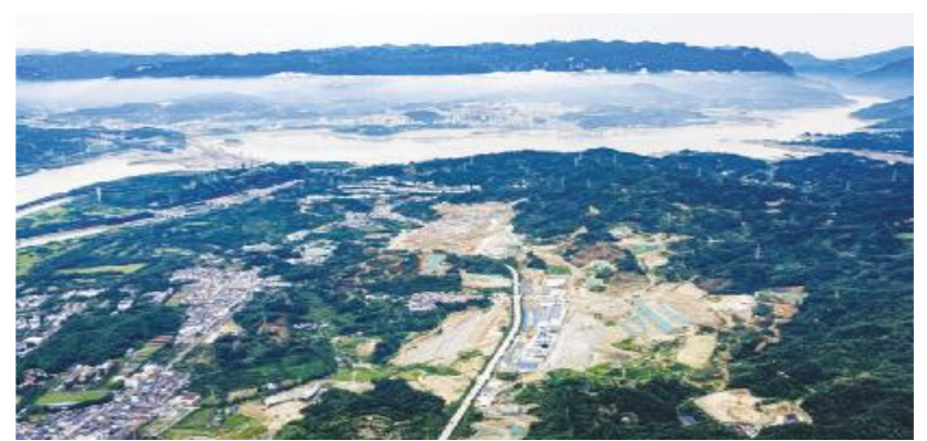
● 三峡水运新通道工程三峡枢纽新通道施工现场