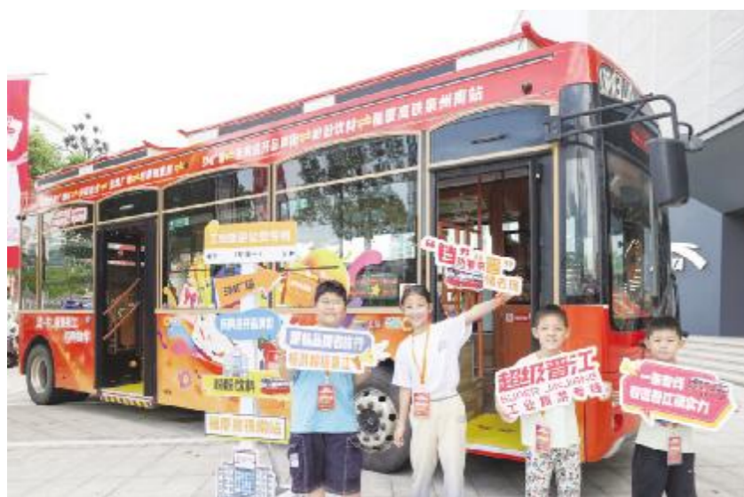
● 小游客体验晋江工业旅游专线。

来旺良品堂闽南古早味传承基地位于晋江市龙湖镇,集非遗传承、民俗体验、研学实践、餐饮购物于一体。基地配备可同时容纳千人的活动空间,面向青少年及游客开展闽南古早味伴手礼制作、民俗文