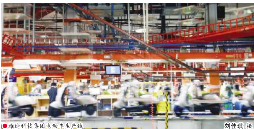
●雅迪科技集团电动车生产线