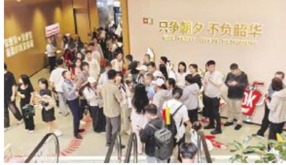
● 在蜜雪冰城总部采访