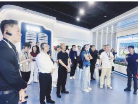
● 在龙门实验室参观