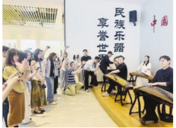
● 在兰考县民族乐器产业园采访