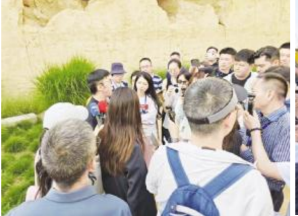
● 在只有河南·戏剧幻城采访