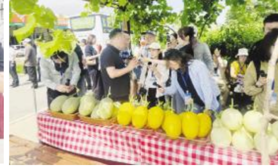
● 在兰考县新发地蜜瓜园区采访