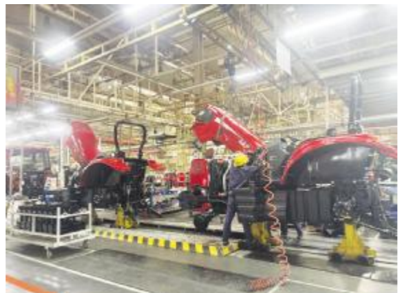
● 中国一拖集团生产车间