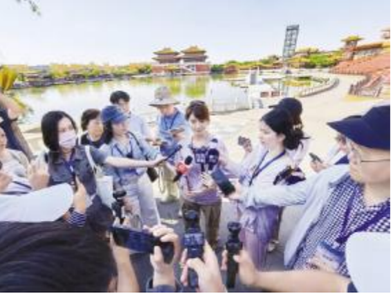
● 在清明上河园采访

在东方红农耕博物馆,一件件文物展品完整展现了我国农机工业从无到有的发展历程。从新中国第一台履带式拖拉机,到搭载北斗自动驾驶、无级变速的大马力智能农机,两岸记者驻足观看历史展板、老式农机实物,深入了解一拖七十载深耕农机装备、守护国家粮食安全的发展故事。