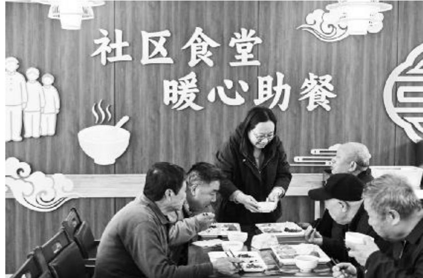
●2026年4月29日,在江苏省扬州市江都区邵伯镇甘棠社区幸福邻里食堂,社区工作人员给老年居民端汤。

“金钥匙”,环环相扣、相辅相成,既指明方向,又给出实招,清晰勾勒出服务业发展的新路径。