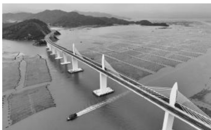
这是4月21日拍摄的福建宁德市霞浦县海上高速公路东岸特大桥周边海上养殖区及山海景观(无人机航拍)。

智改数转增强产业动能。2025年,福建省新增9家国家卓越级智能工厂、38家国家级5G工厂,培育42家省级数字化标杆企业,关键环节全面数字化企业比例达73.1%,居全国第2位。