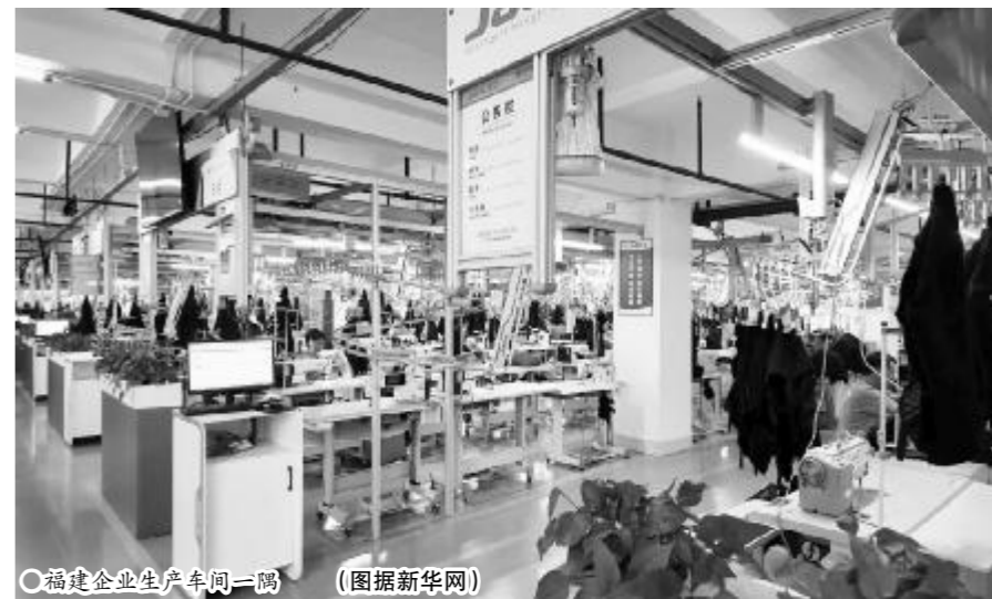
福建企业生产车间一隅