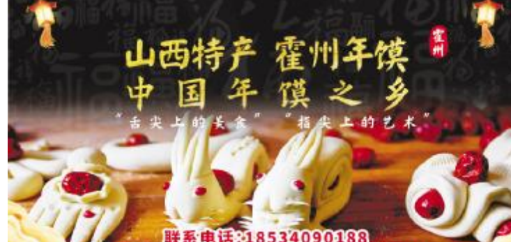
山西特产 霍州年馍 中国年馍之乡

研究团队攻克数字孪生测评方法,参考数据集及模型可信度计算等关键技术,形成典型测控装备智能化测评方法,构建形成典型测控装备智能化测评体系,形成典型测控装备智能化测评方法,构建形成典型测控装备智能化测评体系。