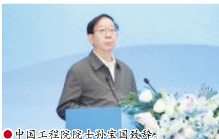
●中国工程院院士孙宝国致辞。