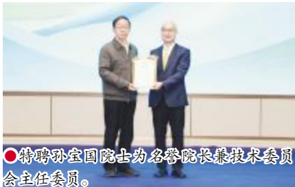
●特聘孙宝国院士为名誉院长兼技术委员会主任委员。