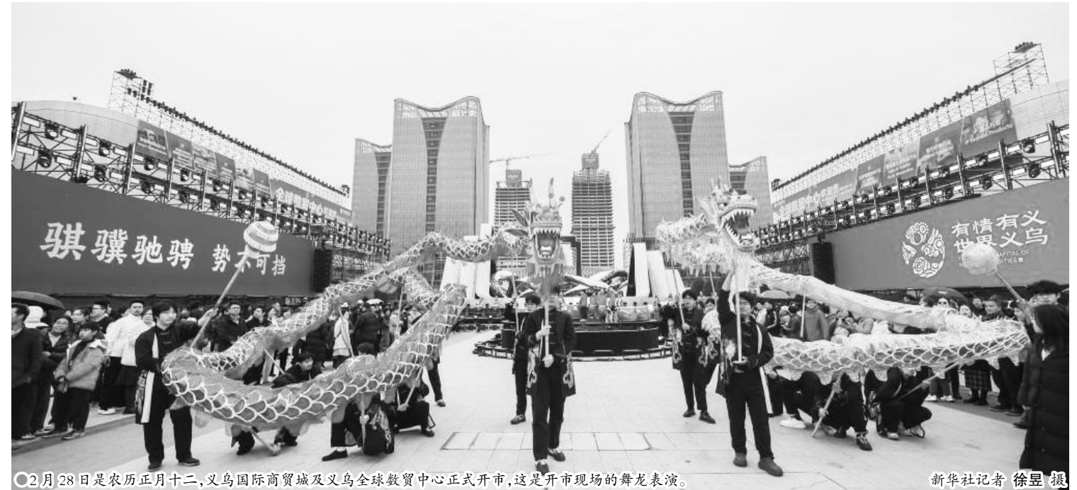
3月28日农历正月十二,义乌国际商贸城及义乌全球数贸中心正式开市,这是开市现场的舞龙表演。