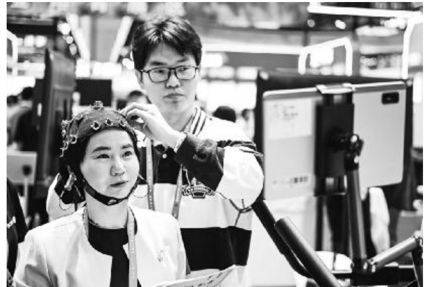
4月26日,参会人员第四届中国(安徽)科技创新成果展示交易会体验一款机械接口产品。

建设,不仅是地理范围拓展,更是国家层面在科技创新顶层设计上的重要强化。”长三角国家技术创新中心主任刘庆表示,科创中心建设提速,标志着长三角一体化协同迈向新台阶。