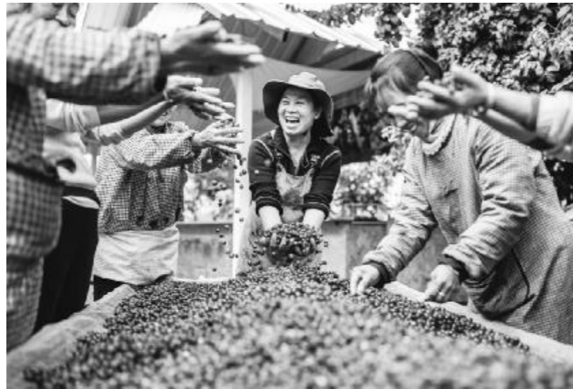
● 2025年1月8日,在云南省普洱市思茅区天玉咖啡庄园,庄园经营者和工作人员庆祝咖啡丰收。

旅居经济的活力,唤醒了许多“空心村”。曲靖市马龙区的土瓜冲村,曾因人口外流留下120多间闲置老屋。转机始于2023年,通过“政府主导、企业运营、村民参与”的模式,村里有70余间老屋被“修旧如旧”改造为精品民宿。2024年6月以来,土瓜冲村接待游客超40万人次,留下了20余户长期居住的旅居客。村民不仅