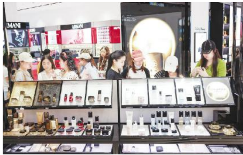
顾客在海口日月广场免税店选购商品。