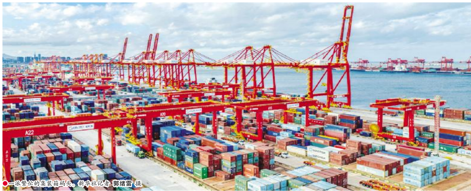
繁忙的集装箱码头。