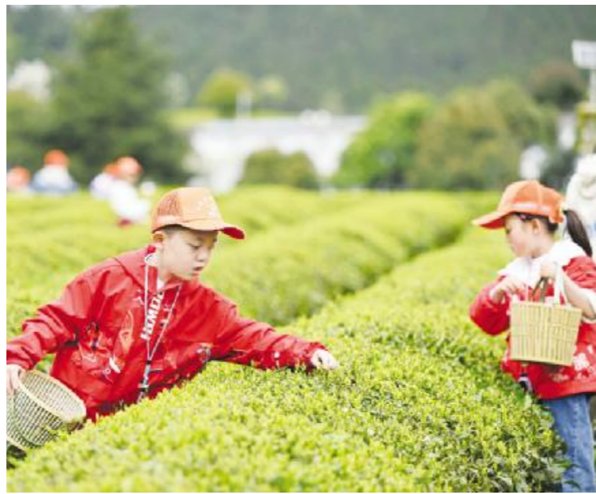
4月1日,小朋友在贵阳市开阳县龙岗镇坝子村生态茶园体验采摘春茶。

从消费趋势看,游客越来越在意住和玩能否自然融合。春假期间,儿童友好型民宿热度同比上涨三成,成为亲子家庭的热门选择。这些民宿不仅提供适合家庭入住的多居室房型,还配备儿童洗浴用品、拖