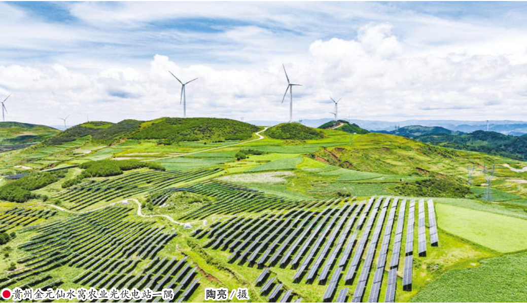
●贵州金元仙水高农业光伏电站一角

超140万亿元——这一数字标注出中国经济发展新刻度。 拉长时间轴看,世界第二大经济体稳步迈进:“十四五”时期,中国经济总量先后逼近110万亿元、120万亿元、130万亿元、140万亿元新台阶,经济年均增长5.4%,人均GDP连续3年超过1.3万美元。 置于全球坐标中观察,5.0%的增速在主要经济体中名列前茅,对世界经济增长的贡献率预计达到30%左右,中国始终是世界经济增长可靠的“动力源”与“稳定器”。 “2025年,国民经济运行顶压前行,向新向优,高质量发展取得新成效,经济社会发展主要目标任务圆满完成,‘十四五’胜利收官。”国家统计局局长康义评价。 以“数”观势,这一年中国经济成长壮大的足迹愈发清晰—— “稳”的格局巩固:规模以上工业增加值比上年增长5.9%,城镇调查失业率平均值为5.2%,货物贸易规模再创新高,外汇储备余额超3.3万亿美元; “进”的步伐有力:规模以上高技术制造业增加值占规模以上工业增加值比重升至17.1%,最终消费支出对经济增长贡献率超过五成,居民人均可支配收入实际增长5.0%,与经济增长同步; “新”的动能壮大:规模以上数字产品制造业增加值比上年增长9.3%,绿电、绿能、绿色经济蓬勃发展,新能源汽车国内新车销量占比超过50%;