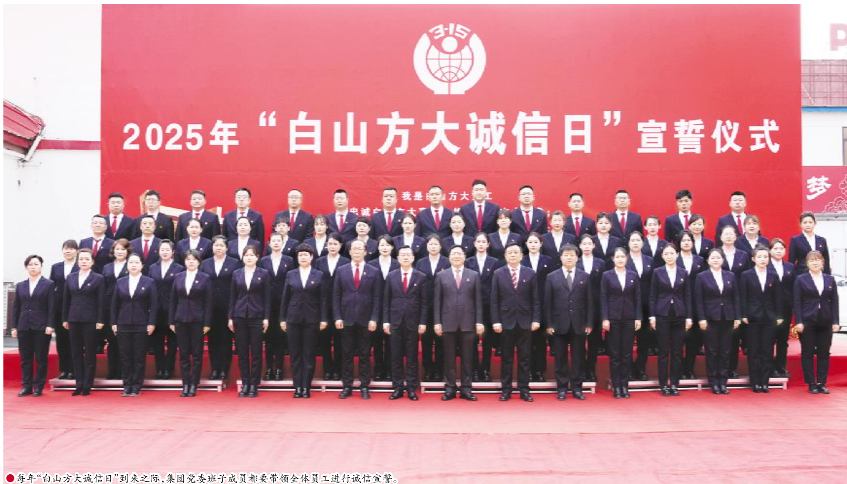
●每年“白山方大诚信日”到来之际,集团党委班子成员都要带领全体员工进行诚信宣誓。

会议号召,白山方大集团全体员工要在企业高质量发展的进程中,始终遵循“守法诚信,以德经商”的经营理念,始终把诚信当作企业生存之本、立业之要,发展之基,坚决抵制各种侵害消费者权益的行为,恪守商业道德,履行各项承诺,开展有序竞争,提供优质服务,为实现把“白山方大”建成百年老店的美好梦想,为以中国式现代化全面推进强国建设、民族复兴伟业而团结奋斗。