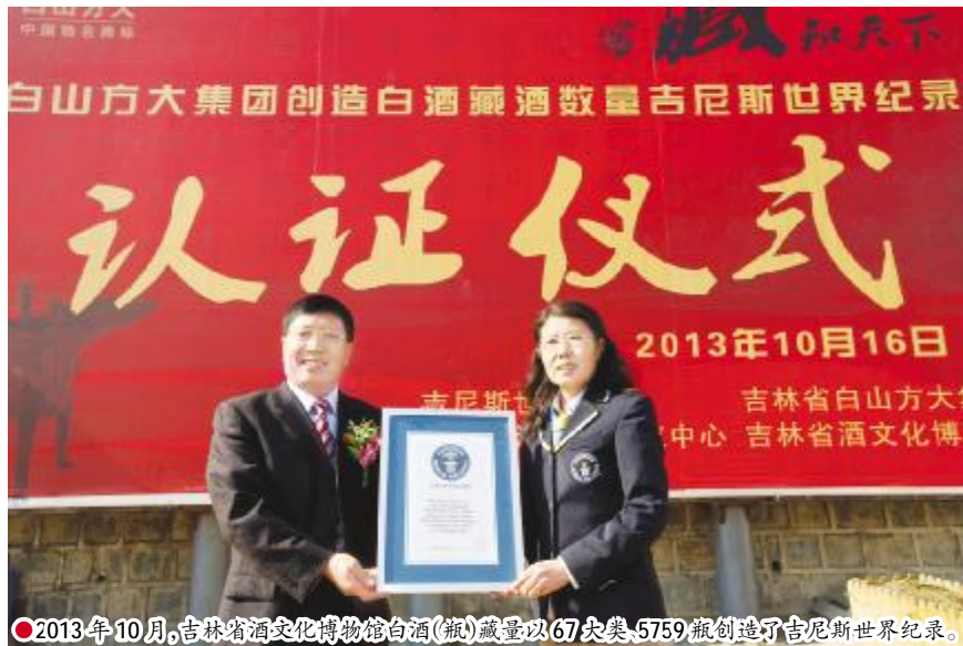
●2013年10月,吉林省酒文化博物馆白酒(瓶)藏量以67类、5759瓶创造了吉尼斯世界纪录。