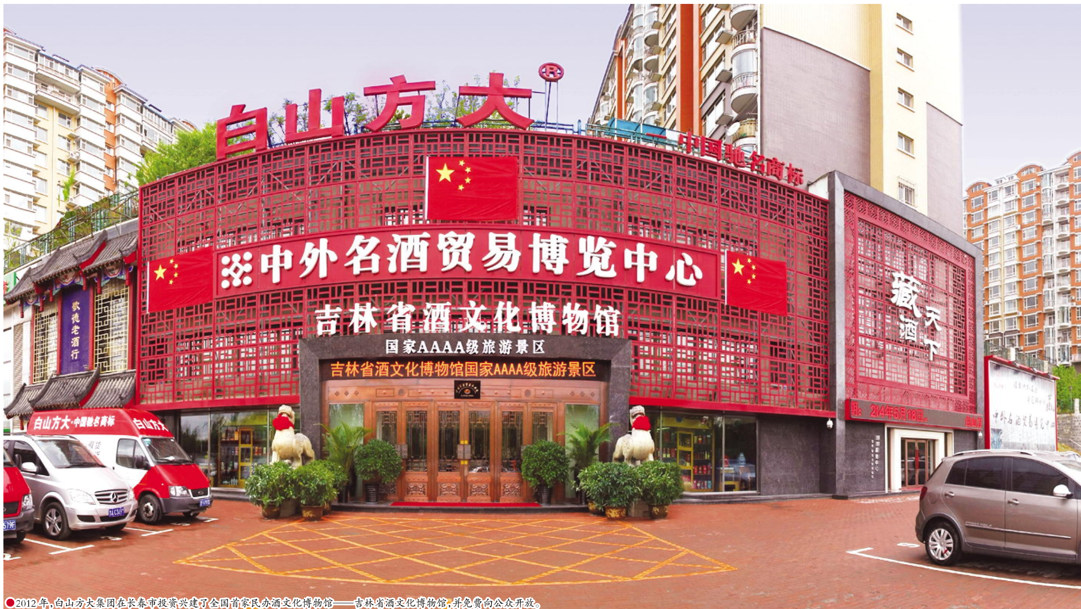
●2012年,白山方大集团在长春市投资兴建了全国首家民办酒文化博物馆——吉林省酒文化博物馆,并免费向公众开放。