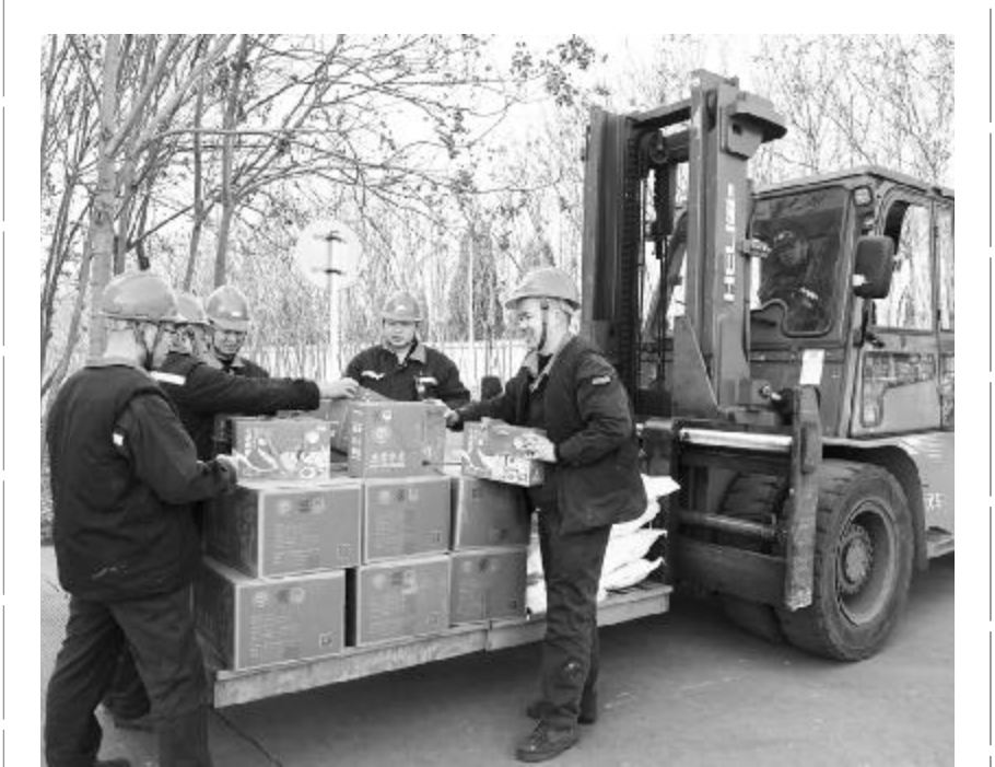
春节将至，淮北矿业集团生产装备分公司精心选购优质的米面油和五谷杂粮大礼包发放到每一名职工手中，把企业的关怀与温暖送到职工心坎上，让职工开心过大年。图为职工开心领取年货“大礼包”。

“谈工作有事例、有数据，讲问题不足不遮不掩、实事求是，这次通过‘阅卷’不仅进行了总结提升，更是为各单位新的一年工作的良好起步开阔思路。希望大家继续书写新一年的奋斗答卷，争取在 2025 年的‘考试’中争得更优异的好成绩！”该矿矿长暴晓庆说道。