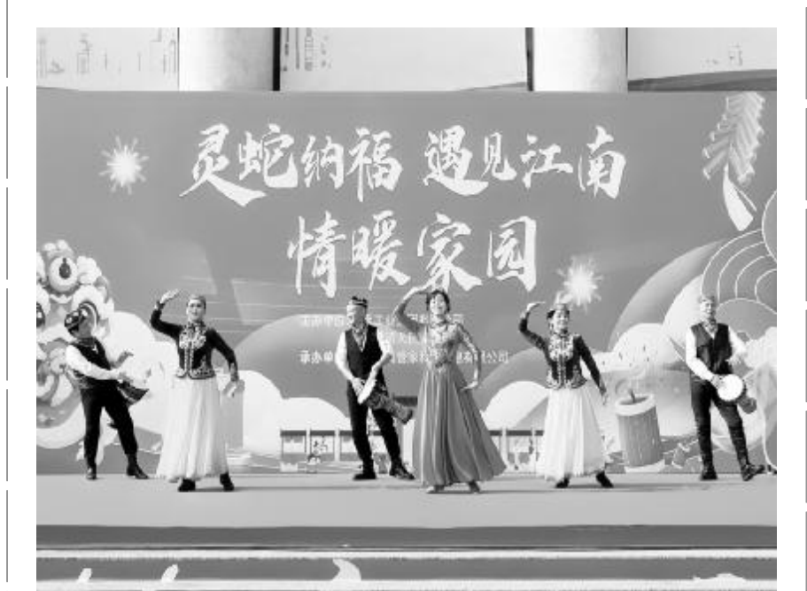
1 月 21 日至 23 日，中国兵器江南工业集团联合湖南省楠竹山镇人民政府，共同举办“灵蛇纳福 遇见江南 情暖家园”主题年味活动。活动现场气氛热烈，宛如一幅欢乐祥和的民俗画卷，吸引了上万人次的职工及家属前来参与，共同书写军工小镇的美好篇章。