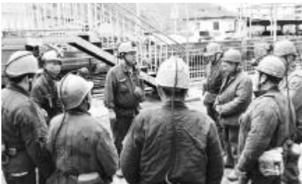
●小旗手班前讲安全