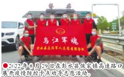
●2022年8月29日在彭水县保家镇高述路口展开疫情防控卡点劝导志愿活动。