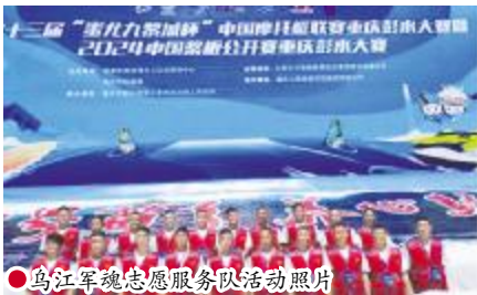
●乌江军魂志愿服务队活动照片

按照“五有”“全覆盖”要求,精心组织、周密安排,精细建设,建成全国示范型退役军人服务站58个,高质量示范型退役军人服务中心(站)各1个,精品红色文化退役军人服务站1个,全县336个退役军人服务中心(站)建成达标、规范运行。在高速公路服务区、下塘加油站等人员流动较大的场所,建成拓展性退役军人驿站2个,延伸服务触角,让退役军人获得感成色更足。贯