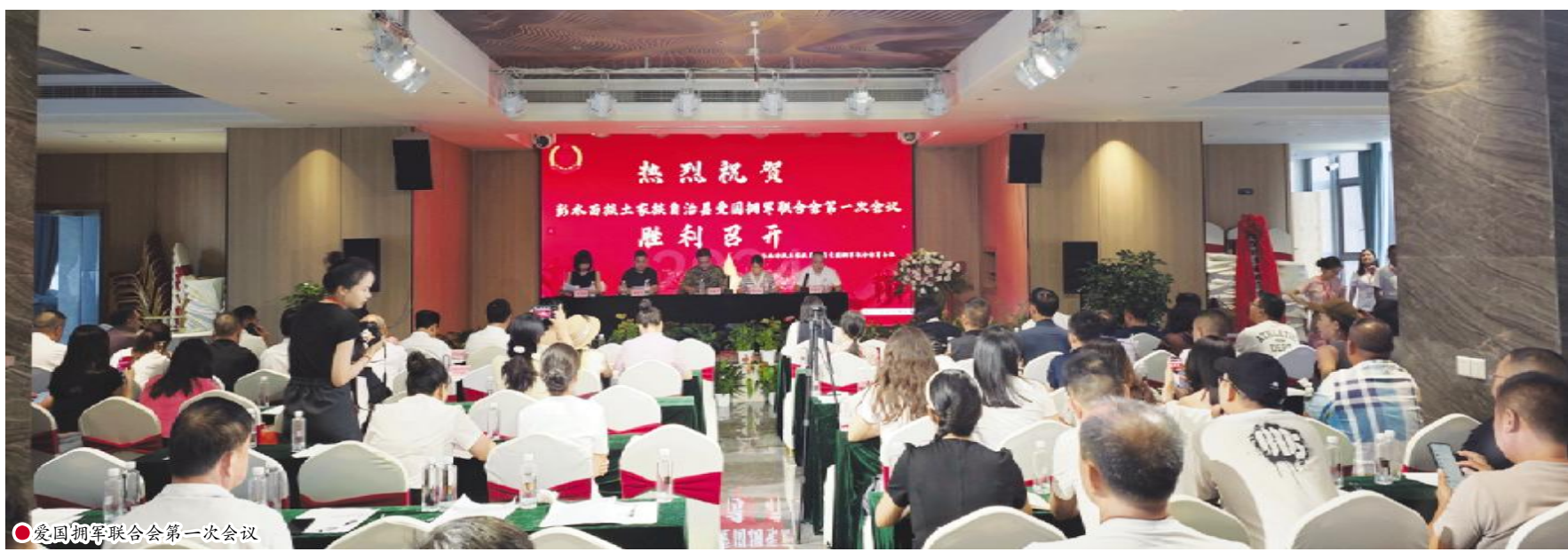
●爱国拥军联合会第一次会议