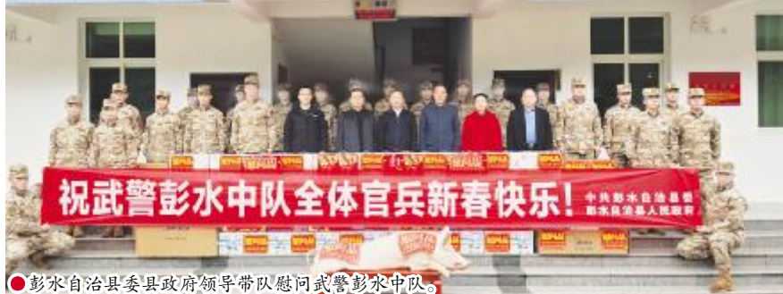
●彭水自治县县委县政府领导带队慰问武警彭水中队。

彭水“乌江军魂”志愿者以无私的奉献精神,积极传递社会正能量,为彭水经济社会高质量发展贡献退役军人志愿服务力量。