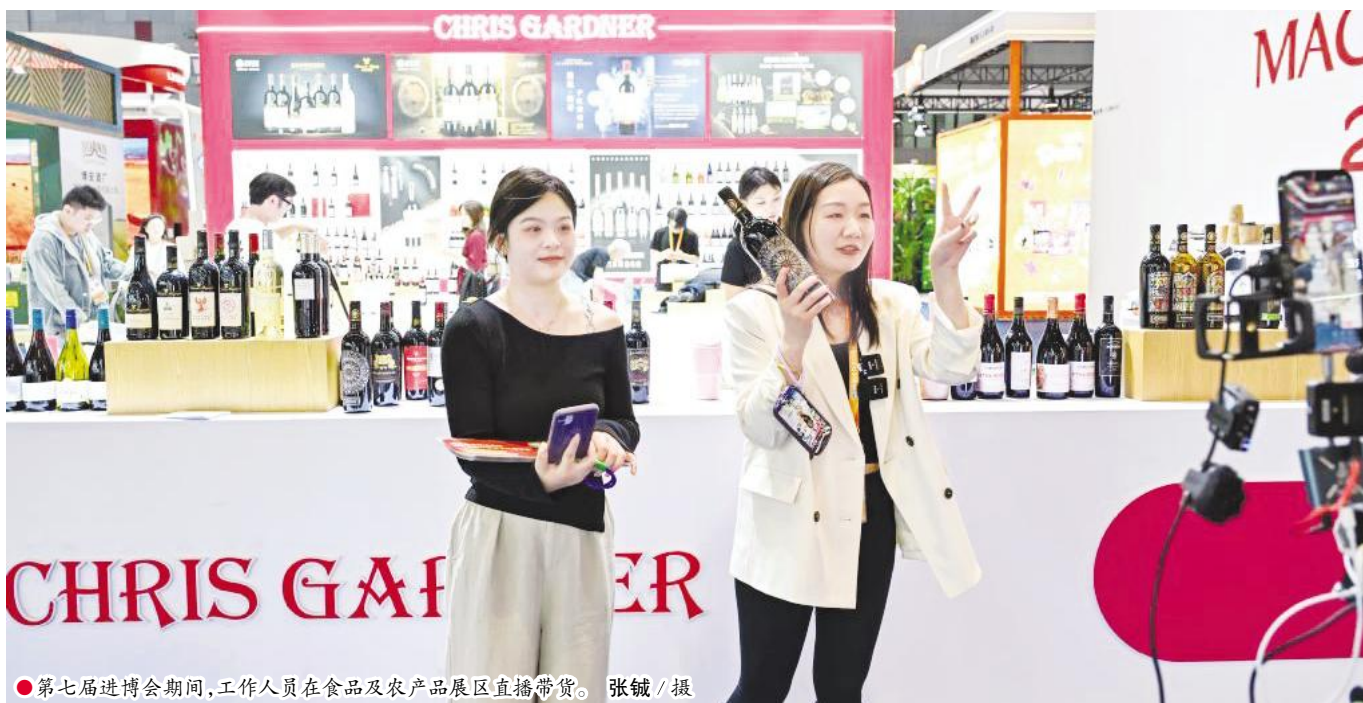
●第七届进博会期间,工作人员在食品及农产品展区直播带货。