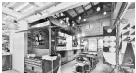
安踏 0 碳使命店内开设的“再造工坊”,消费者可以参与材料DIY服务。

遇到有重要事项需要上级部门协调的事情,也是领导带头协调,不用企业过多操心,“光伏一条街,以及全省第一家‘算力一条街’。”