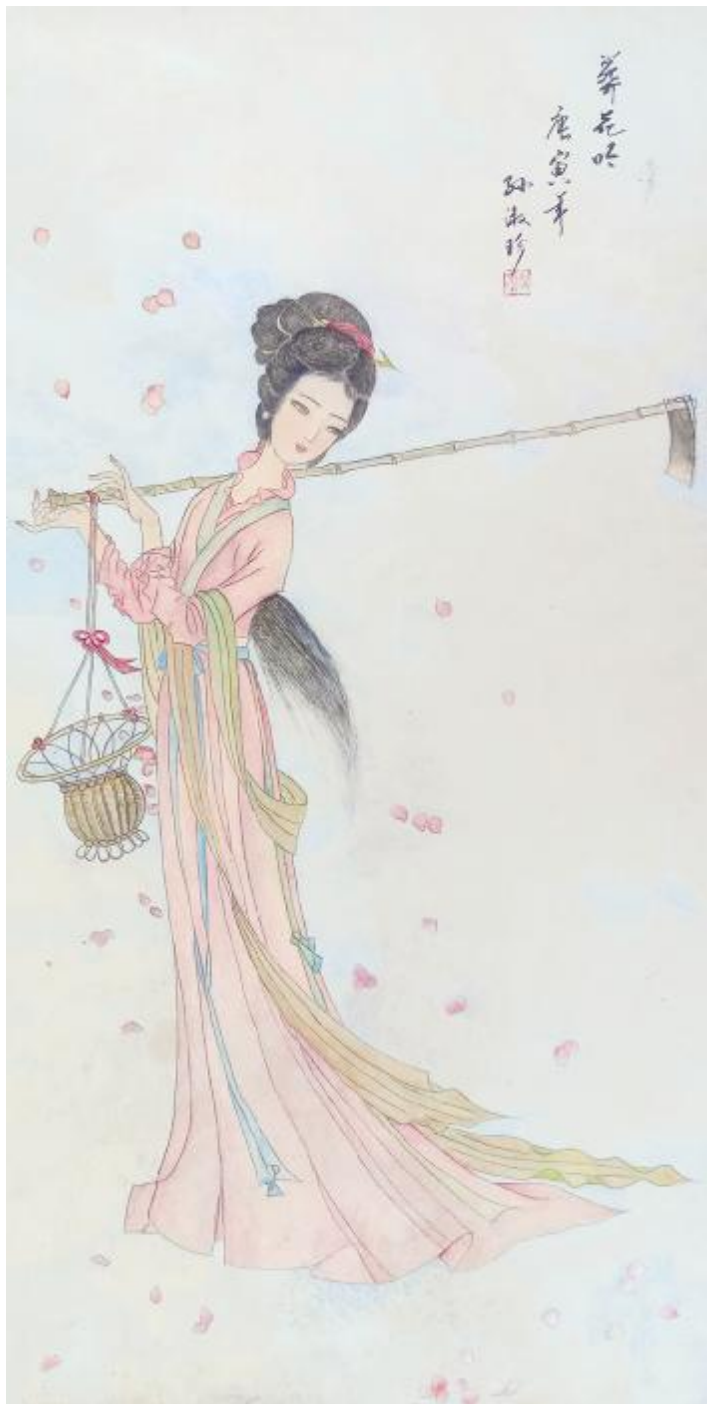
孙淑珍作品《葬花吟》