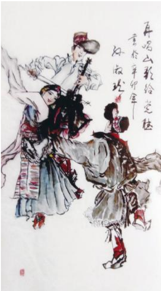
孙淑珍作品《再唱山歌给党听》