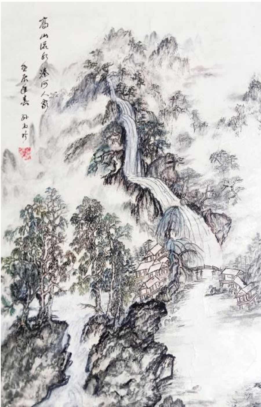
孙淑珍作品《高山流水滦河人家》