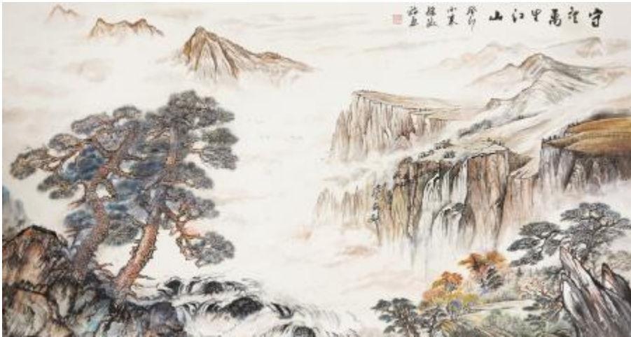
孙淑珍作品《守望万里江山》