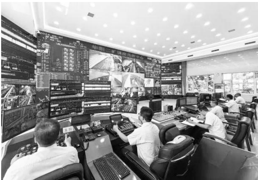
● 华阳二矿调度指挥中心