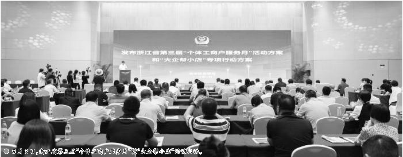
○ 9月3日，浙江省第三届“个体工商户服务月”暨“大企业帮小店”活动启动。

为赋能个体工商户高质量发展，各部门将立足职能、贴近实际，开展各类主题活动。如，市场监管部门将积极推进个体工商户分型分类精准帮扶，“市场监管+金融”赋能滴灌、个体劳动者技能富业、“百家市场十进服务”“放心消费‘浙’里说”、赋能“名特优新”类放心消费单位、个体工商户电子计价秤培训宣传、个体工商户质量管理体系认证提升等14项举措；浙江省人力社保厅将开展“源头好创业”资源对接服务季、“直播带货”云招聘等活动，为个