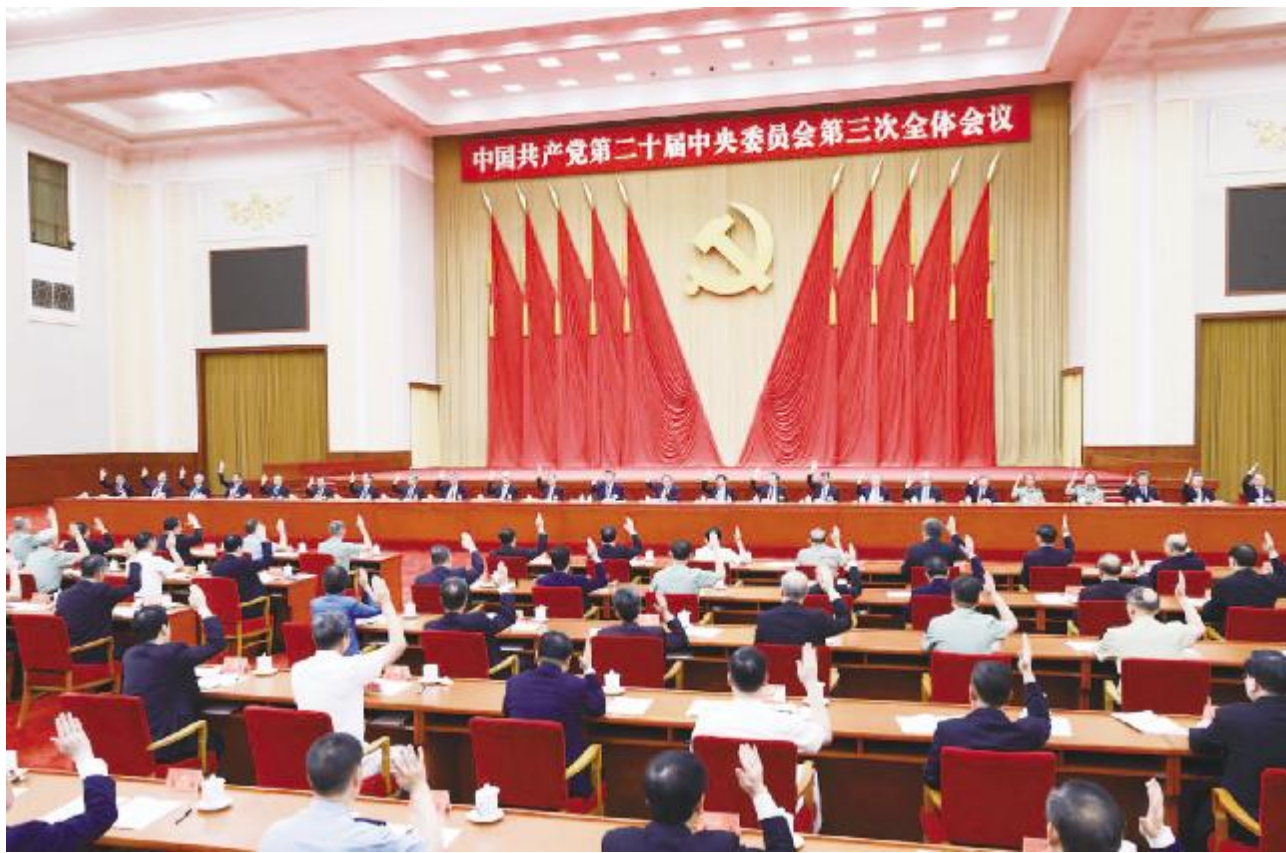
●中国共产党第二十届中央委员会第三次全体会议,于2024年7月15日至18日在北京举行。中央政治局主持会议。