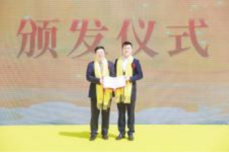
●向皇沟酒业颁发“甲辰龙年黄帝故里拜祖大典供奉酒证书”

组委会对皇沟馥香酒卓越品质、独特风味、厚重文化的高度认可,也是豫酒品质自信、风味自信、文化自信回归的新解。希望皇沟酒业始终以传播中华文化为己任,擦亮家乡名片,匠心酿造时代好酒,做大做强民族品牌,通过皇沟馥香酒,让更多人读懂河南,让世界人民更好地了解中国。 河南省工业和信息化厅二级巡视员王高潮在致辞中强调,皇沟馥香是一个兼具历史底蕴与卓越品质和独特风味的豫酒品牌。皇沟酒业以弘扬和传承“兼容并蓄,文化大一统”的汉文化为己任,与黄帝文化同根同源,一脉相承。被