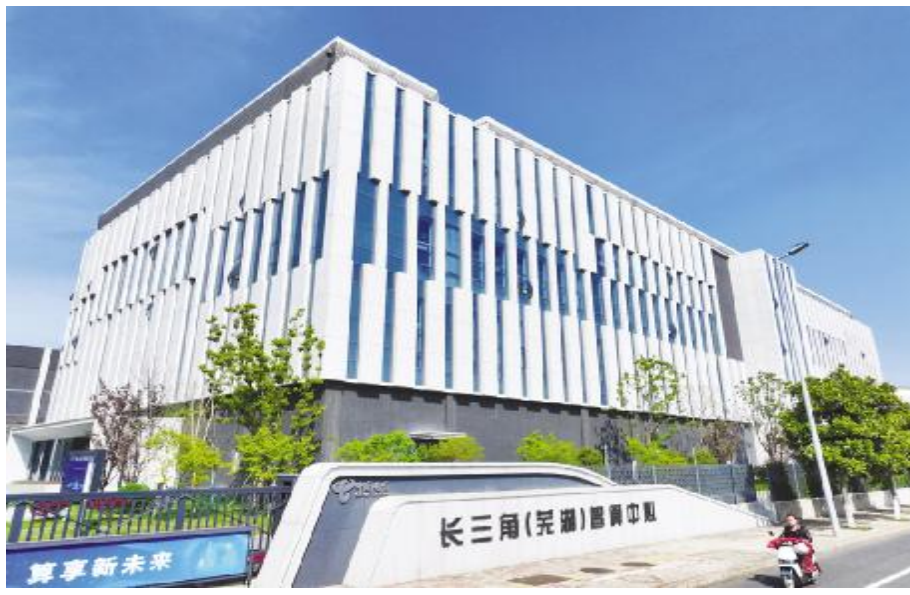
●安徽省芜湖市鸠江区清江路芜湖大数据产业园,航拍中国电信长三角(芜湖)智算中心。(无人机照片)