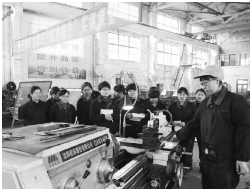
●协庄镇矿女职工“技术能手”实训课堂

“多亏了‘妈妈小屋’,我才能兼顾孩子和工作。”近日,“新矿”服务站第 4 期“妈妈小屋”里,一名二胎女职工用挤奶器为宝宝储备“口粮”。