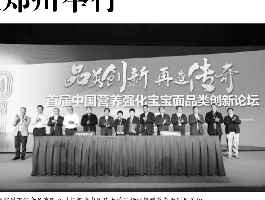
●郑州万豪食品有限公司与河南中医药大学进行控糖养麦面项目签约。