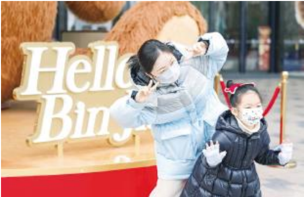
● 龙湖滨江天街里的母女