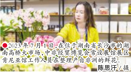
●2023年7月1日，在位于湖南省长沙市的湖南高桥大市场，中非经贸博览会常设展馆展区肯尼亚馆工作人员在整理产自非洲的鲜花。

湖南省中非经贸合作促进研究会会长徐湘平说：“总体方案的实施，不仅对非经贸合作具有重要意义，而且对于构建人类命运共同体、助力湖南高质量发展和高水平开放，具有重大的现实和历史意义。”（据新华社）