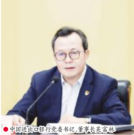
●中国进出口银行党委书记、董事长吴富林

答：政策性金融是中国特色现代金融体系的重要组成部分，中国进出口银行将深入学习贯彻中央金融工作会议精神，将党的领导贯穿于工作全过程各方面，高效落实党中央重大决